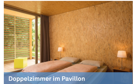
Doppelzimmer im Pavillon